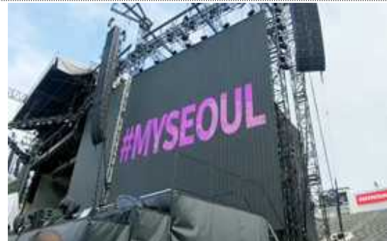
< 서울관광 홍보영상 상영 >