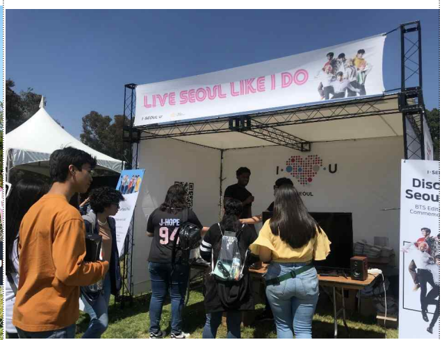
< 서울 도시브랜드(I-Seoul·U) 노출 및 홍보부스 운영모습 >