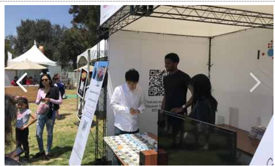
< 서울관광 홍보물 배포(서울관광지도 및 DSP 홍보전단지 포함) >