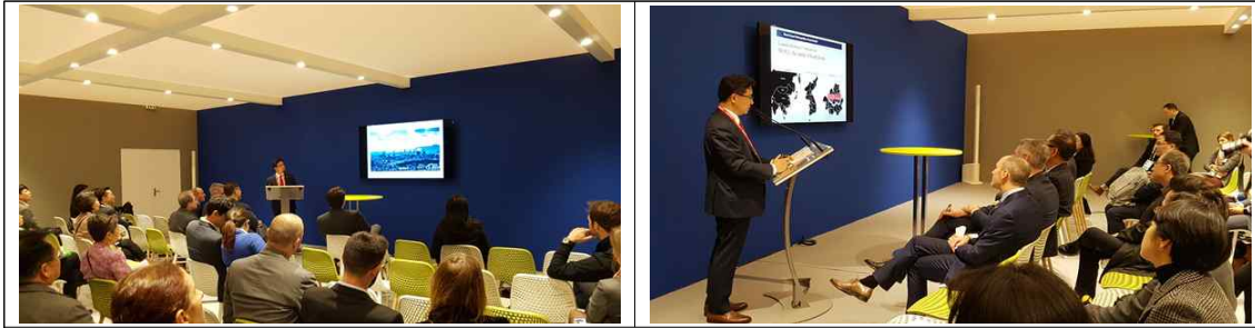
서울 PT - 서울시 관광체육국장