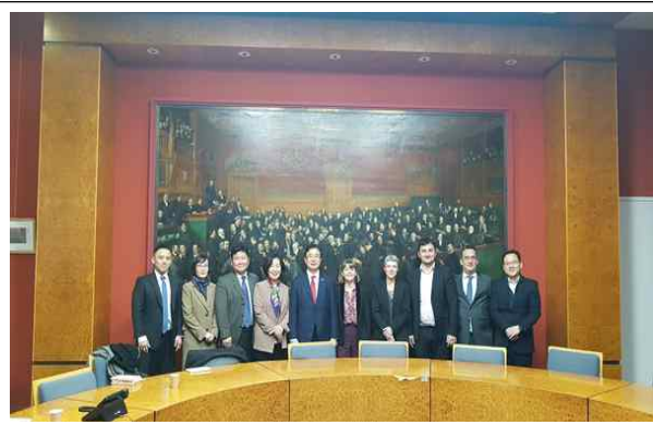
파리 시청 방문 - 파리 부시장 면담