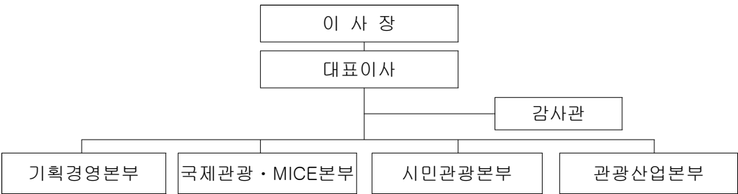
[별표 2] 정원표 <개정 2020.8.28.>