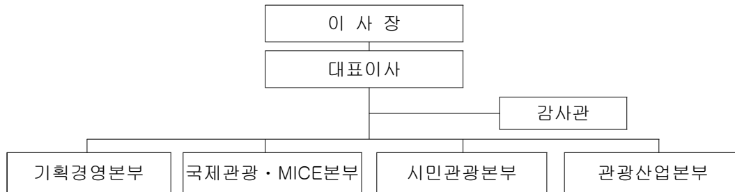
〔별표 2〕 정원표 <개정 2020.8.3., 2021.12.23.>