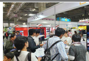
B2C 이벤트 진행 모습