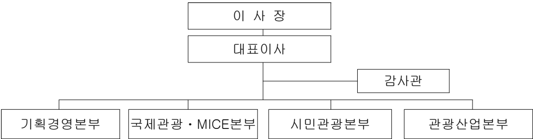
[별표 2] 정원표 <개정 2020.8.28.>