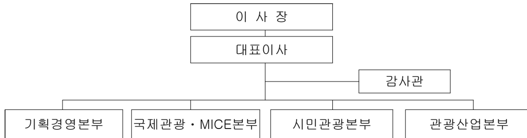
〔별표 2〕 정원표 <개정 2020.8.3., 2021.12.23.>