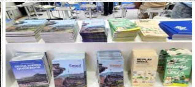
서울관광 홍보물 배부(예시)