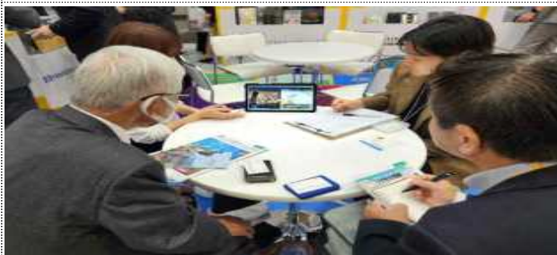
서울관광 비즈니스 상담(예시)