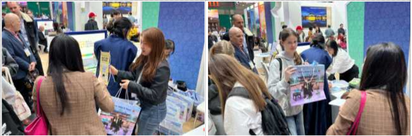
비жит서울 구독이벤트 운영