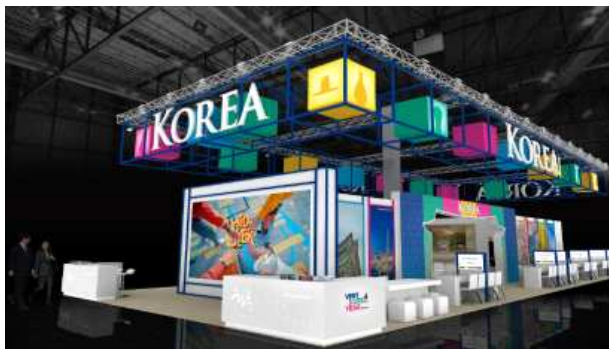
KTO 한국관 전경