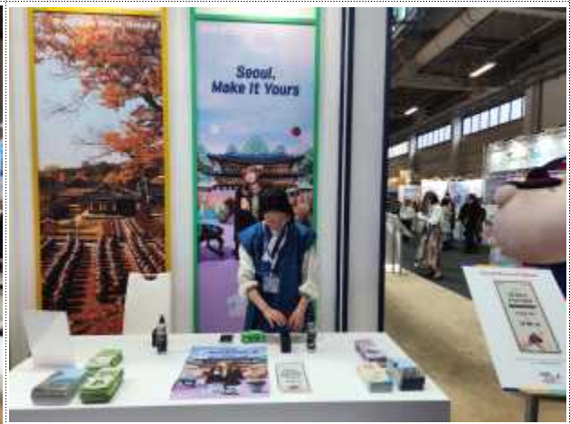
2024 ITB Berlin 부스(서울 브랜드 로고 타투)