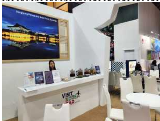
2024 ITB Berlin 부스 디자인(인포데스크)