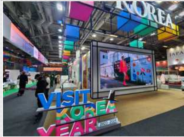
2024 ITB Berlin 한국관 부스 전경