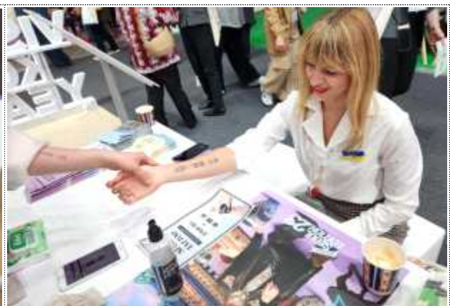
서울 브랜드 로고 타투 체험 이벤트