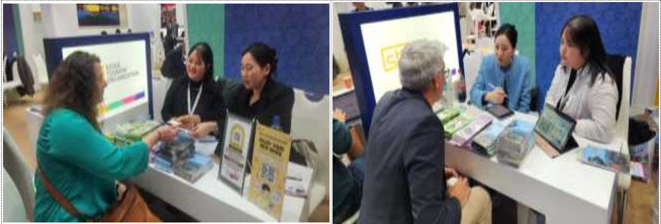
STO 상담부스 운영