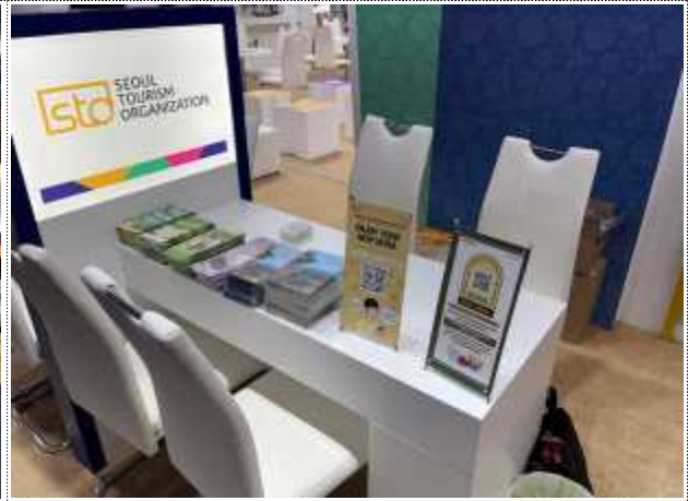
2024 ITB Berlin 한국관 부스(STO 상담존)