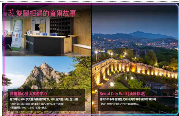
B2B 상담회 진행 자료(예시)