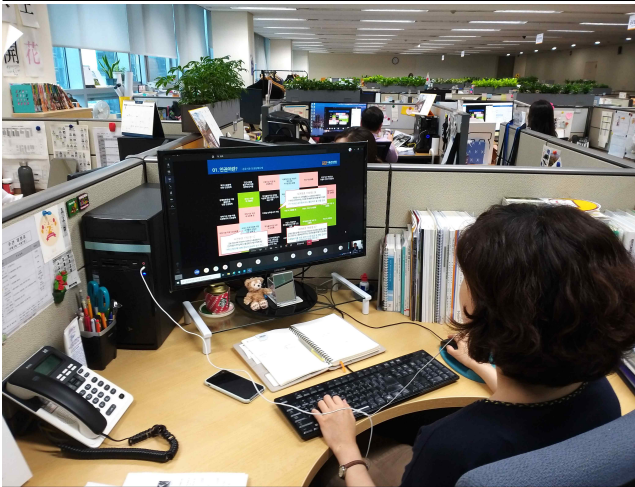
교육에 참여하는 임직원(관광MICE본부)