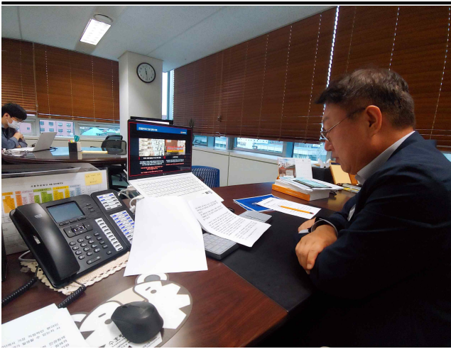
대표이사 교육 현장